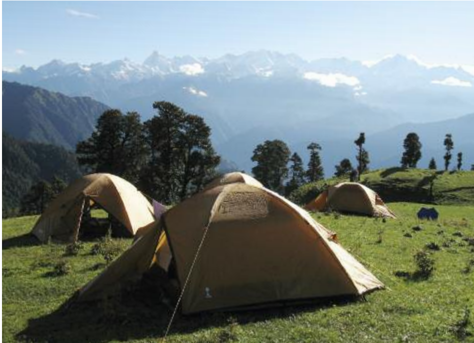
Campübernachtung vor der Nandadevi-Kette (Himalaya).

DEVPRAYAG & GANGA Tage 10/11/12 Frühmorgens brechen wir auf nach Devprayag. Hier vereint sich der Bhagirathi- und Alaknandafloss - der von nun an den Namen Ganges trägt. Es bleibt Zeit die Badeghats und Tempel der heiligen Stadt zu erkunden. 1x ÜN F/P/A in komfortablem Camp am Ufer der "Mutter aller Flüsse". Am nächsten Morgen treiben wir mit unseren Schlauchbooten gemächlich den Ganges flussabwärts, vorbei an Viehherden und kleinen Dörfern. Wir fahren nachmittags ca. 3h weiter durch die Berge und erreichen das kleine Bergdorf Sursinghdhar. Der nächste Tag dient zur Erholung und Entspannung. Auf einem "Village walk" werden wir die Dorfbewohner besuchen und viel über deren Lebensweise und Kultur erfahren. 2x ÜN in schönem Gästehaus mit Blick auf die Vorberge der Himalaya-Ketten. F/P/A