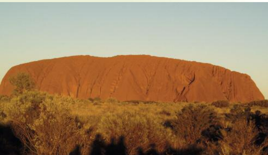
Weltberühmtheit Ayers Rock

Entdecken Sie eine urzeitliche Fauna und Flora in den Savannen, Wüsten, Sumpflandschaften, Regenwäldern und Bergen von Zentral-, Süd-, und Ostaustralien.