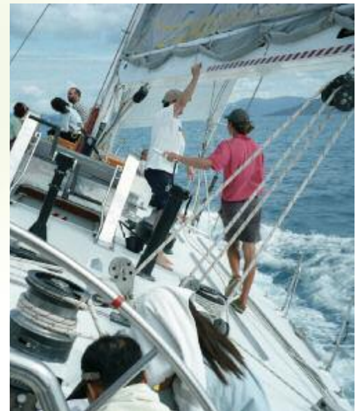
Segeltörn Whitsunday Islands

Der Eungella NP beherbergt eine Vielzahl interessanter Tiere, doch das Faszinierendste ist wohl das Schnabeltier: ein undefinierbares Lebewesen, Mischung aus Säugetier und „Ente mit Fell“. Gelegenheit zur Beobachtung dieser putzigen