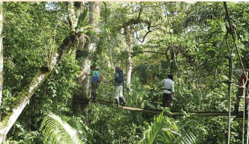
„Sky Walk“ durch die Baumkronen des Regenwaldes

Der feine Sand am Strand und das Süßwasser des Nicaragua-Sees laden zu einem morgendlichen Bad ein. Mit Fahrrädern erkunden wir die Insel, besuchen die Kooperative „Magdalena“ am Fuße des Vulkans Maderas. Wir lernen die Kaffee-Kooperative kennen und wandern zu indianischen Steinzeichnungen, die Zeugnis der alten Geschichte dieser Insel geben. Die Legende sagt, dass der große Lago Nicaragua (8.200km 2 ) aus den Tränen einer Indianerin entstanden ist. 2xÜbernachtung Villa Paraiso Lodge. F/P