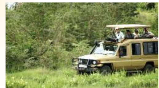
Zum Vulkan Mgahinga