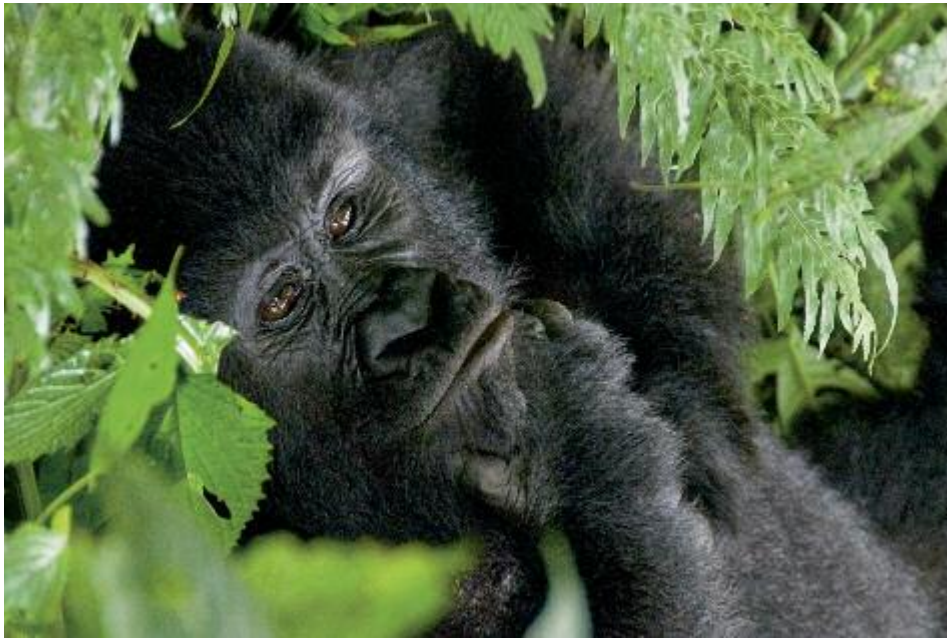
Begegnung in den Virunga Mountains