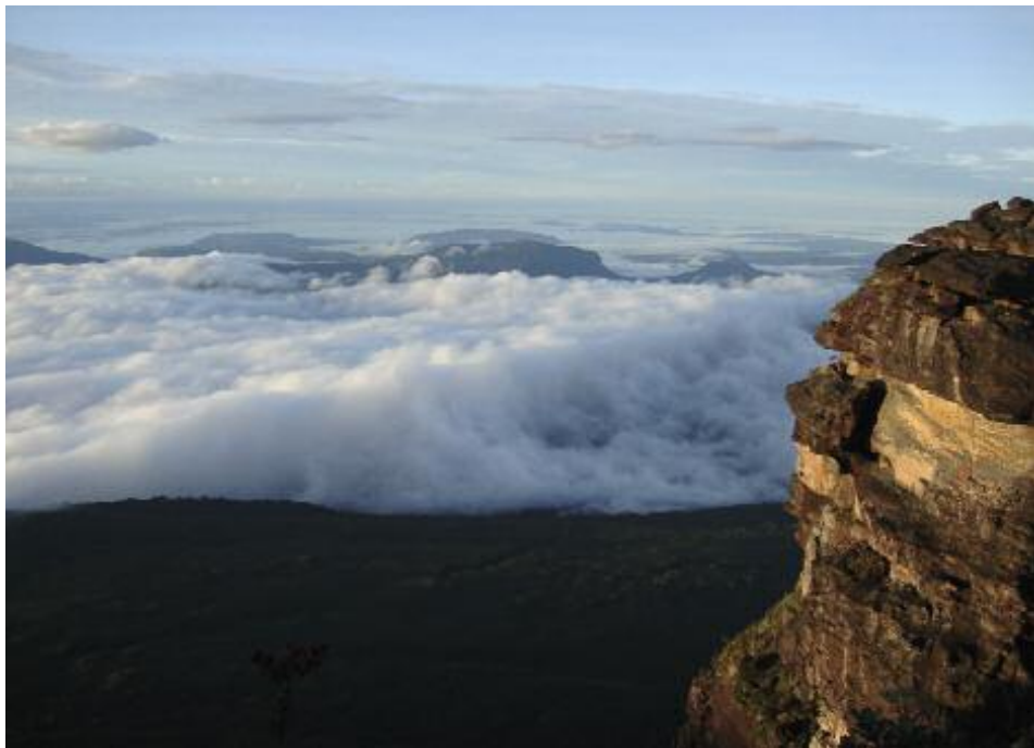
Blick vom Plateau des Auyan Tepui

KOLONIALES BOLIVAR Tag 9 Im Laufe des Vormittags fliegen wir mit Propellermaschinen nach Ciudad Bolivar zurück, quartieren uns im bekannten Hotel ein und feiern die gelungenen Trekkingtage. Am Nachmittag ggf. Stadtbesichtigung wobei uns vor allem der koloniale Stadtkern interessiert. Hotel-ÜN/F