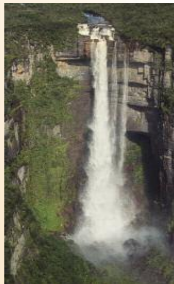
In der Gran Sabana